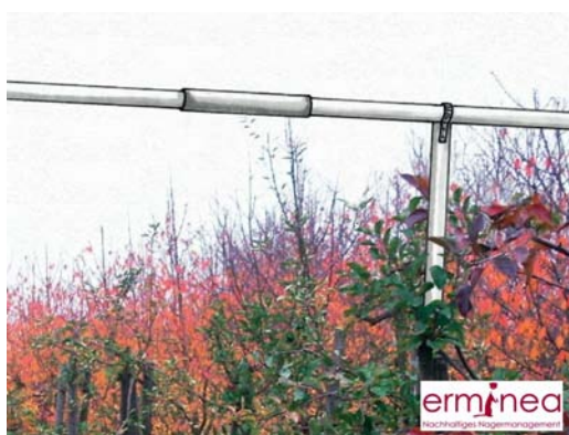
Slika 5. Prečke za grabljivice tvrtke Erminea ( www.erminea.com/Sitzstange.html )

U voćnjak se prema preporuci njemačke tvrtke Erminea GmbH iz mogu postaviti i prečke za grabljivice. Postavljaju se min. 0,5 m iznad visine krošnje i to 4 komada po hektaru. Razmak između prečki treba biti 50 do 80 m.