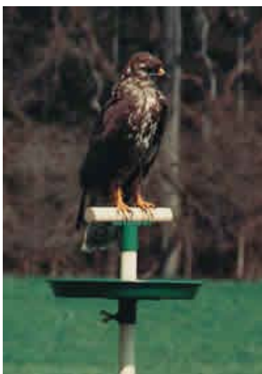
Slika 3. Stup za slijetanje ptica grabljivica s hranilicom ( http://www.schwegler-natur.de/Vogelschutz/index.htm )