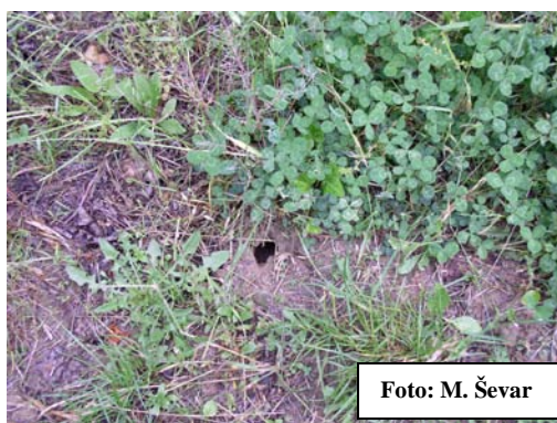
Slika 1. Aktivna rupa glodavca

Najefikasnija borba protiv glodavaca jest obrada tla ispod stabala. Mehanička obrada tla okopavanjem je zahtjevnija, te je za preporuku strojna obrada primjenom rotofreze ili rotodrljače s pomičnim ticalom.