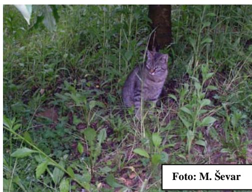
Slika 2. Mačka u lovnom položaju na glodavce

Poznato je da su mačke dobri i aktivni lovci. One se hrane glodavcima, pticama i sl. U voćnjaku gdje se želi zadržati zeleni pokrivač poželjno je osigurati mjesto ne za jednu, već za nekoliko mačaka.