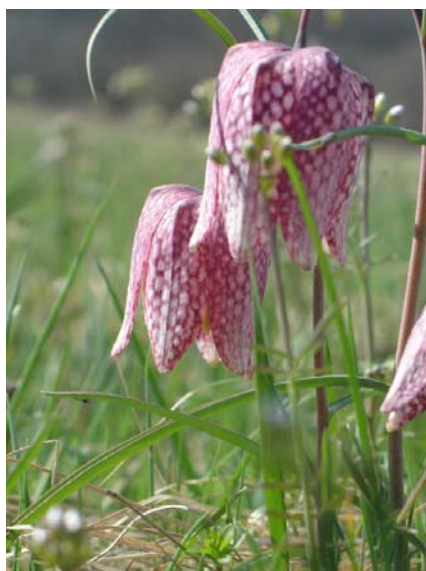
Slika 6. Kockavica

Rodu Fritillaria pripadaju kockavice. One su u RH zaštićene biljne vrste. Međutim, njihove lukovice se mogu kupiti u većim vrtnim centrima. Kockavica cvate u travnju i svibnju a na njenim laticama nalaze se sitne kockice po kojima je i dobila ime.