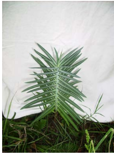
Slika 7. Euphorbia sp.

Biljke iz roda Euphorbia također mirisom odbijaju glodavce. Međutim, iste su opasne za kućne ljubimce i životinje te se njihova sadnja preporuča samo u ograđenim voćnjacima gdje nema kućnih ljubimaca.