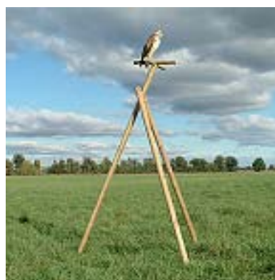
Slika 4. Mobilni stup za slijetanje ptica grabljivica (prema Dornberger-u 1988.) ( http://www.jki.bund.de/nm_811450/DE/Home/pflanzen_schuetzen/oekolandbau/schaedlinge__krankheiten/wuehlmausbekaempfung/sitzkruecken.html )